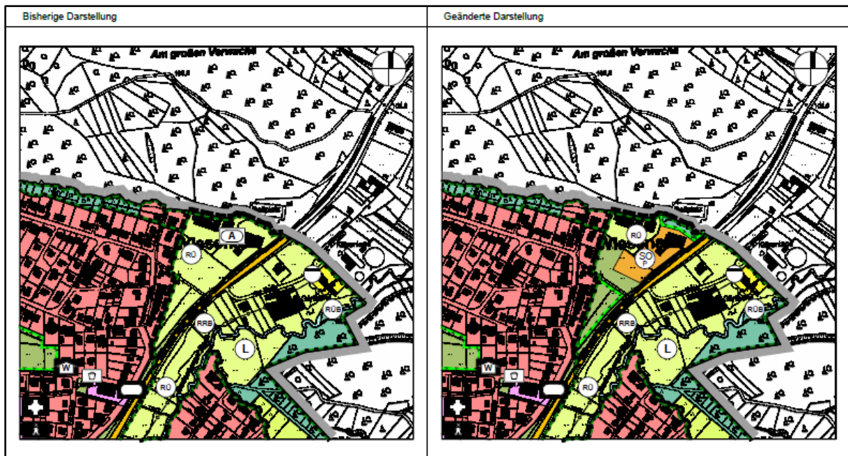
Abbildung 2: Auszug aus der Plandarstellung zur 2. Änderung des Flächennutzungsplans (NAUMANN 2023)

Der Flächennutzungsplan (FNP) der Gemeinde Wachtberg stellt das Plangebiet aktuell als landwirtschaftliche Fläche dar. Die 2. Änderung des Flächennutzungsplans der Gemeinde Wachtberg erfolgt im Parallelverfahren zur Aufstellung des Bebauungsplans. Sie umfasst die geänderte Darstellung aktueller landwirtschaftlicher Flächen, die zukünftig als „Sonstiges Sondergebiet, Zweckbestimmung Pflegeeinrichtung“ dargestellt werden.