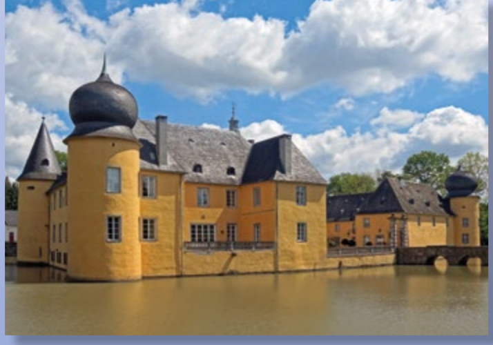
Die Wasserburgenroute führt u.a. an der Burg Gudenuau in Villip vorbei.

Das Bürgerbüro ist bereits ab 07.30 Uhr geöffnet. Außerhalb der Öffnungszeiten Termine nach Vereinbarung.